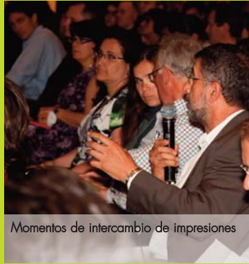
Momentos de intercambio de impresiones