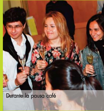
Durante la pausa café