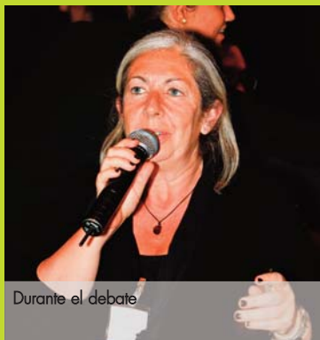
Durante el debate