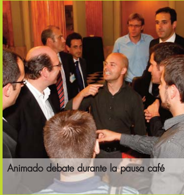
Animado debate durante la pausa café