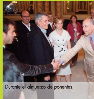
Durante el almuerzo de ponentes