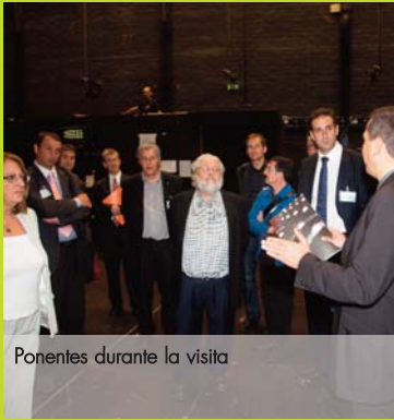
Ponentes durante la visita